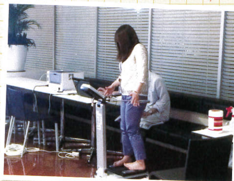
骨格筋量、体脂肪量、部位別のバランスなど、細かく測定。