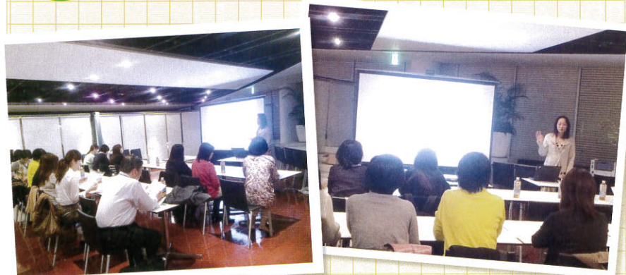
食事、睡眠、お砂糖の話など、最新の栄養学について説明。